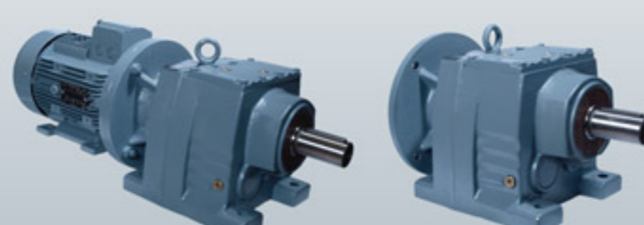
گیربکس های شافت مستقیم سری R