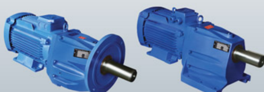
انواع گیربکس های شافت مستقیم طرح VEM

امیدواریم بتوانیم با همکاری های سازنده در پیشبرد صنعت کشور کوشا باشیم.