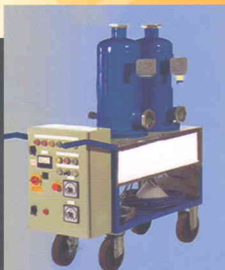
دستگاه تصفیه مذاب آلومینیوم (گاز زدایی)

دلیل ممتاز بودن کیفیت محصول آذر صنعت گلپایگان است.